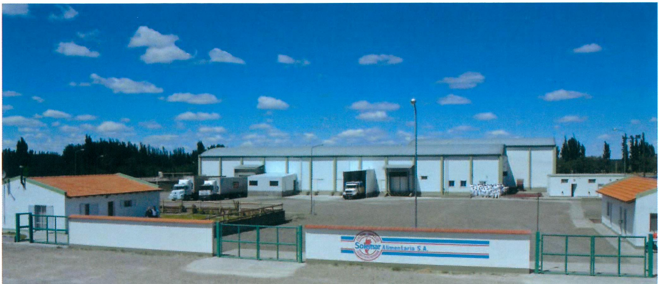
Nell'immagine, la Naba Carni nella Patagonia del Sud

sciuta nel tempo e andrà a crescere, diventando un affare per tutte queste imprese farmaceutiche. Ragion per cui bisogna educare affinché l’animale, in particolare a fine carriera, non debba essere macellato, ma debba avere assistenza e eventualmente morire di morte naturale. Così si organizzano a libro paga animalisti, vegani con manifestazioni anti-macellazione , anti – ippofagi, animalisti e quelli che io chiamo “mistici animalisti”, etc... Negli Stati Uniti nel 2008 diviene legge il divieto di macellazione Equini per consumo umano e in Europa entra in vigore la legge 504 nel 2009. È l’“inizio della fine”. Per poter macellare un equino è necessaria una documentazione faraonica che nemmeno nei bovini, dopo patrimoni di investimenti in 80 anni, non hanno ancora raggiunto. In breve con la legge del proibizionismo naturale nasce il contrabbando da uomini senza scrupoli e questa si può dire essere la somma dei quattro casi di concorrenza sleale di cui parlavo in premessa”.